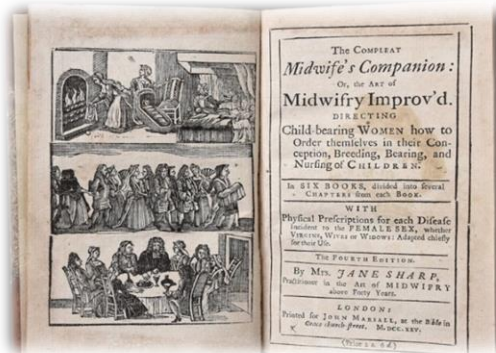
Figura 2: Frontispicio realizado por Jane Sharp, primera matrona inglesa en escribir un tratado

Sebastián Covarrubias (de Covarrubias, 1611) dice de la comadre que “vale madre juntamente con la que lo es verdadera: y llamamos comadre a la que ayuda a parir, que cura de la madre, y de la criatura. Esta por otro nombre se llama partera. Latín obstetrix (...) Llamanse comadre las que acompañan a la criatura, y la reciben de mano del padrino, quando la sacan de la pila”. En esta definición puede apreciarse que la comadre, en su atención al parto, cuida tanto de la madre como del recién nacido. Sorprende que, aunque el diccionario no arrojará ninguna entrada al buscar partera, aquí sí refiere su otra denominación. Así mismo, recoge otra de sus funciones, la de ejercer como madrina durante el bautismo. Cuando el parto era exitoso, los padres otorgaban a las matronas el privilegio de ser la madrina del bebé y llevarlo a su bautizo, al menos fue común entre los círculos reales y nobles (Foster, 1980) (Figura 2).